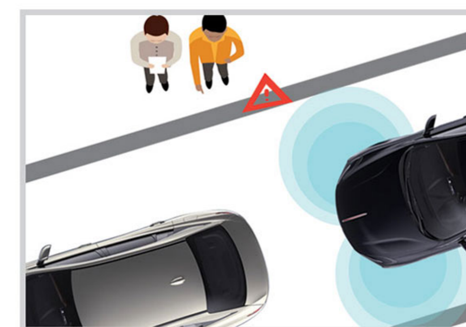
..... هشدار برخورد از جلو (FCW)