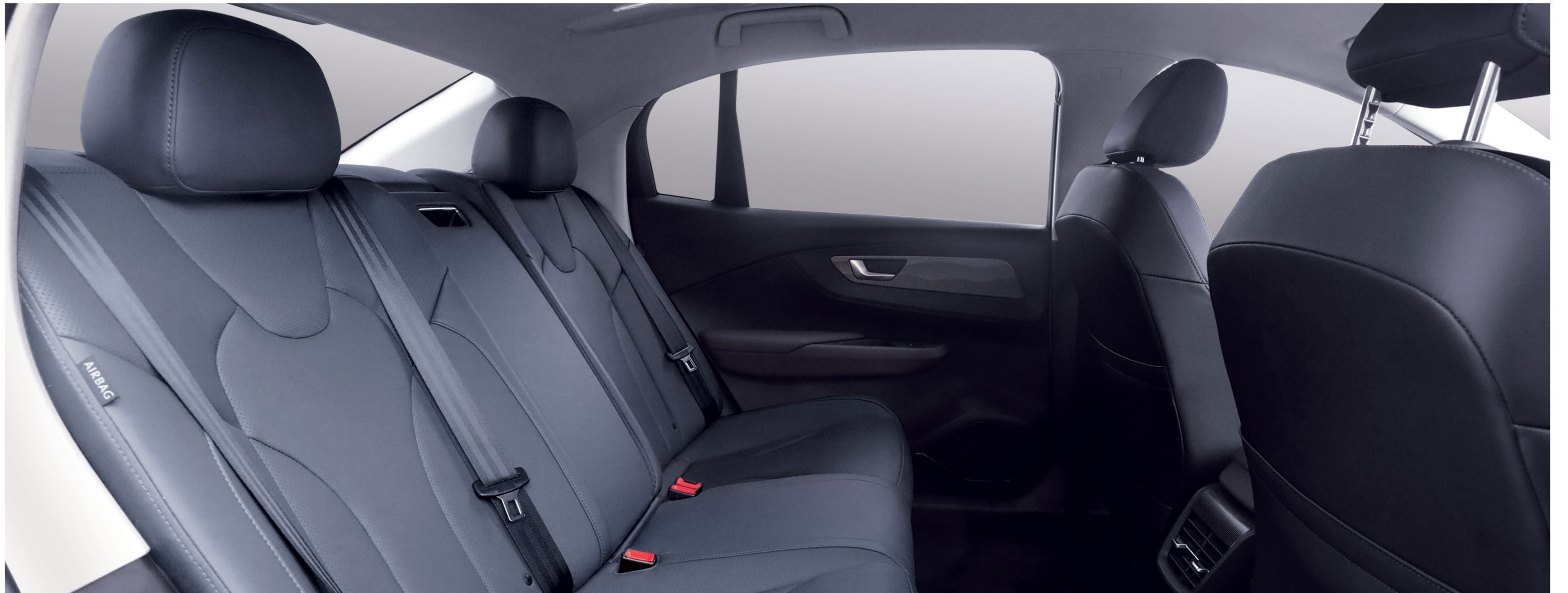
..... کابین مدرن و بزرگ