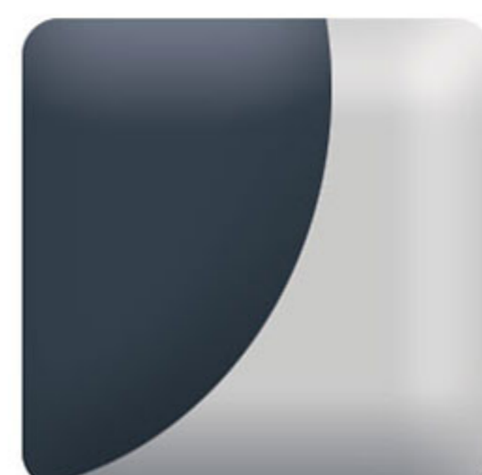
تریم داخلی: فاکستری - آبی