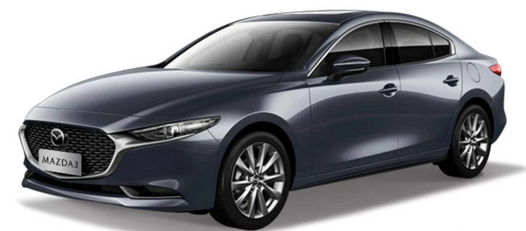
Dark Gray خاکستری تیره