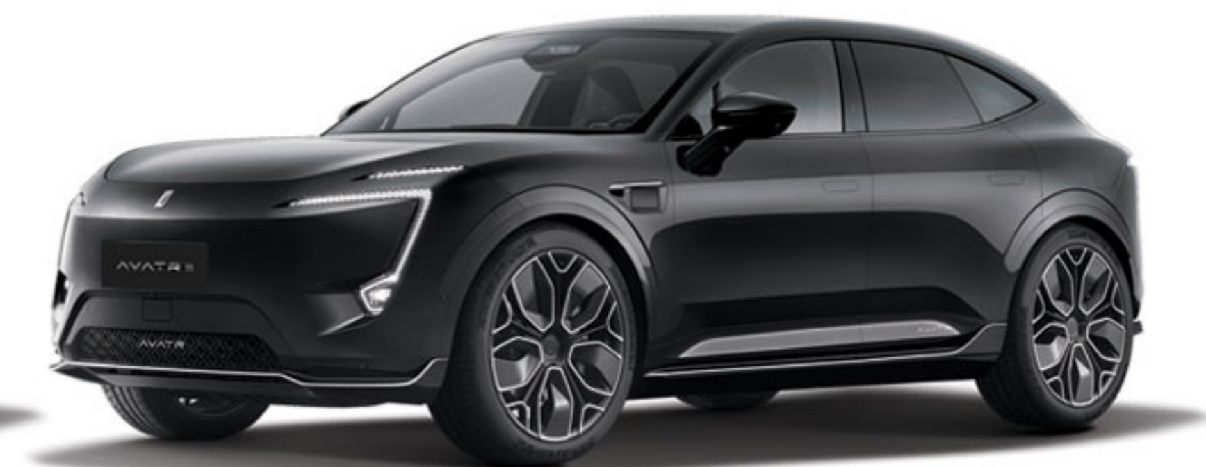
تریم داخلی: قرمز (بورگاندی)